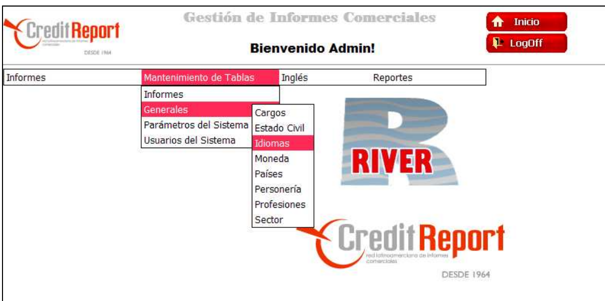
Gráfico 2: Pantalla Principal del Sistema

Una vez ingresado al sistema, este presenta el menú de opciones de toda la aplicación. Este menú aparecerá con más opciones para el Usuario con perfil de Administrador que para el de Digitadora.