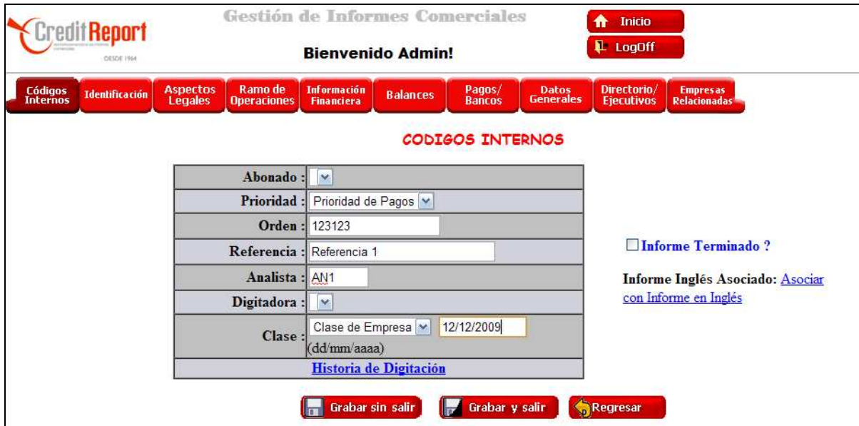
Gráfico 3: Administración del Sistema

El ingreso de un informe crediticio de una empresa tiene varios grupos de datos (los cuales se separan en las diferentes etiquetas mostradas en la parte superior). También se debe asociar con su equivalente en idioma inglés para poder sincronizar la información entre ambos.