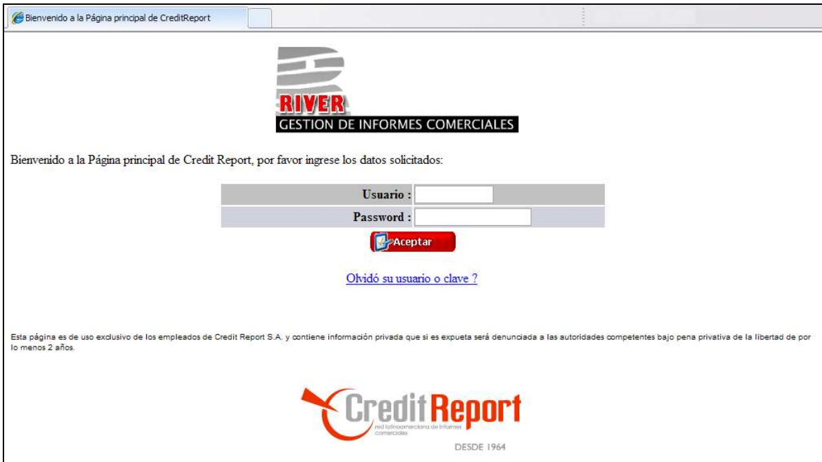
Gráfico 1: Ingreso al Sistema

El ingreso al sistema se realiza mediante la solicitud del nombre de usuario y de su clave. Existen 2 niveles de acceso a la aplicación: Digitadoras y Administradores.