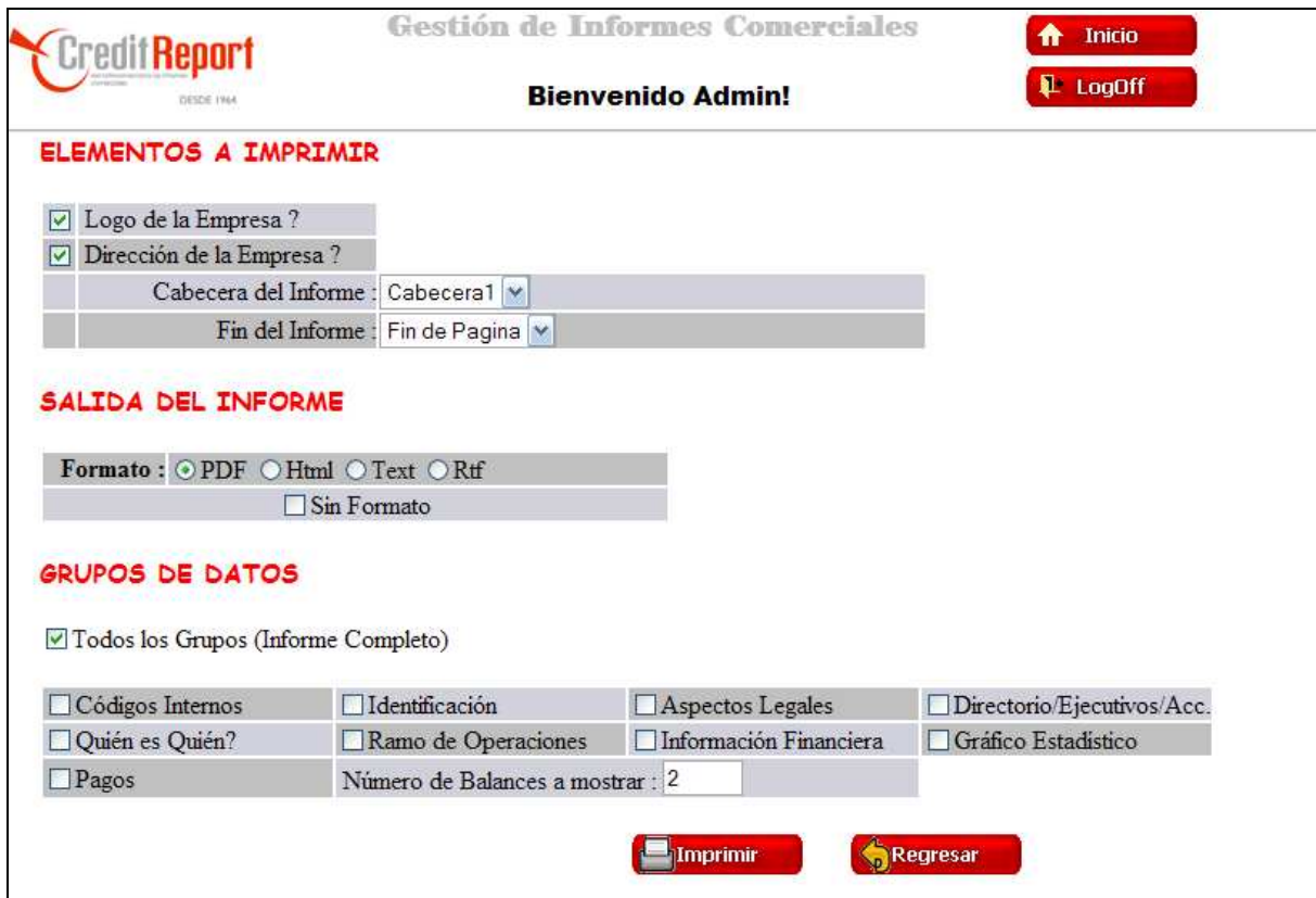
Gráfico 4: Pantalla de Impresión de los Informes

Una vez llenado el informe y haber sido aprobado para su impresión, el sistema muestra una pantalla donde el usuario puede seleccionar las características del informe a imprimir. Entre ellas tenemos la cabecera del reporte, si se imprime el logo, si se imprime la dirección, el formato de salida del informe (pdf, txt, Word, etc.) y los grupos de datos que se mostrarán.